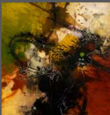
Point de service 30 x 30 po.