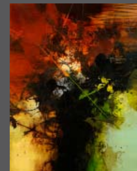
Traversée vers la terre rouge 60 x 48 po.