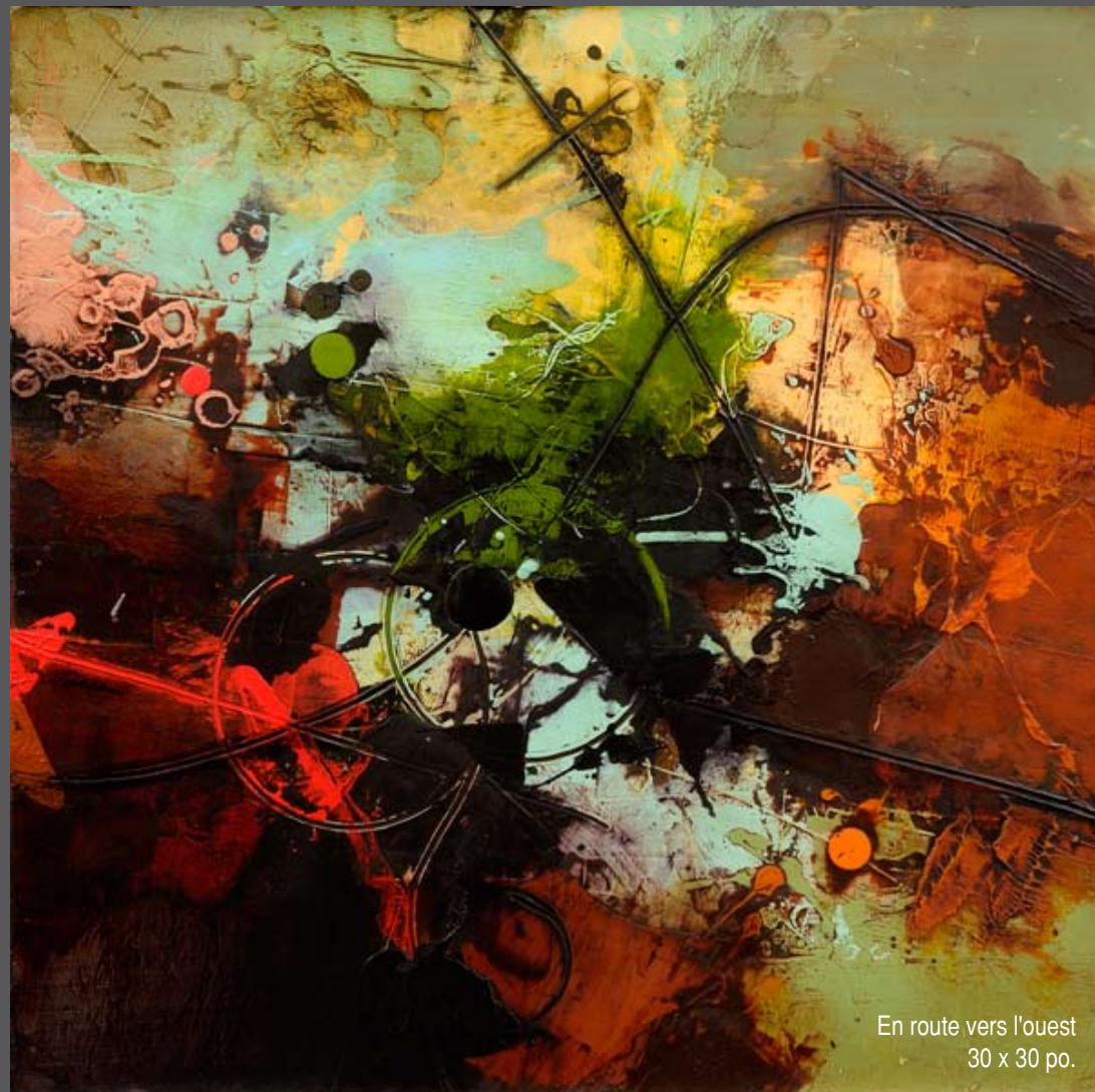
En route vers l'ouest 30 x 30 po.

2009 Nomade, La collection Loto-Québec en mouvement 2002 12 artistes, tendances contemporaines, Galerie Tremblay-Monet, Montréal 2001 Belleau, Groleau, oeuvres récentes, Galerie Encadrex, Montréal 1995 - Le maître, qui est ton maître ?, Centre de créativité des salles du Gesù - Quarante artistes canadiens, Galerie Shorer, Montréal - expo-vente à la Sun-Life, appuyée par le Conseil de la peinture du Québec - Expo-Arte, Guadalajara, Mexique 1994 Peintures récentes, Galerie Simon Blais, Montréal 1993 À bruit secret, Galerie d'art du Collège Edouard-Montpetit. Oeuvre retenue pour le concours Duchamp-Villon. 1992 L'eau, source de plaisir, SEDI, Montréal 1992 Entrée libre à l'art contemporain, (E.L.A.A.C.), représenté par la Galerie Simon Blais. 1991 Échec à la reine, Galerie d'art du Collège Édouard-Montpetit, Longueuil. Pièce retenue pour le concours Duchamp-Villon. 1990 Oeuvres sélectionnées par la Galerie Stewart-Hall, Pointe-Claire (oeuvres sur papier) 1990 Carrefour Art & Art, Montréal (techniques mixtes sur papier)