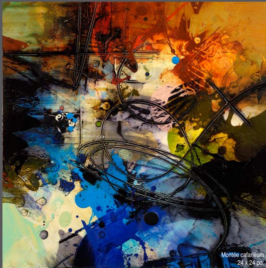
Montée cafarléum 24 x 24 po.