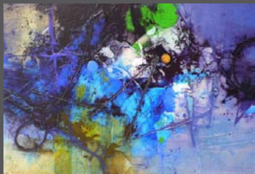
Route en dents de scie 24 x 36 po.