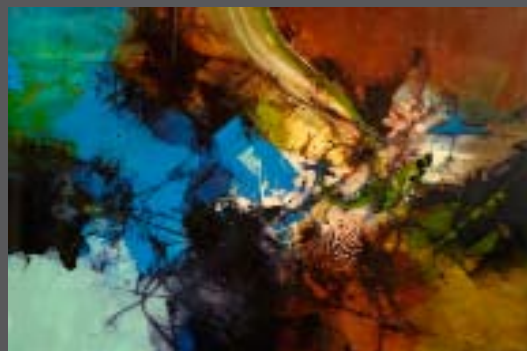
Chemin de traverse 48 x 72 po.