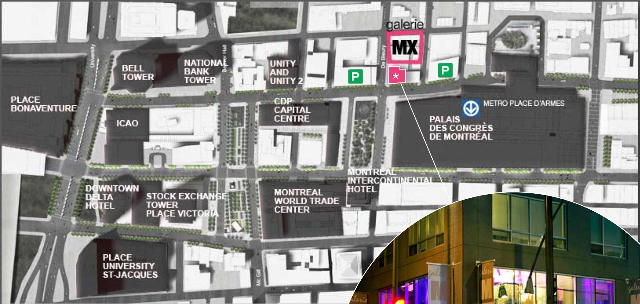
Map Montreal's International District